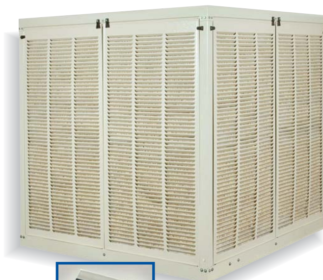
ED143 / ED213