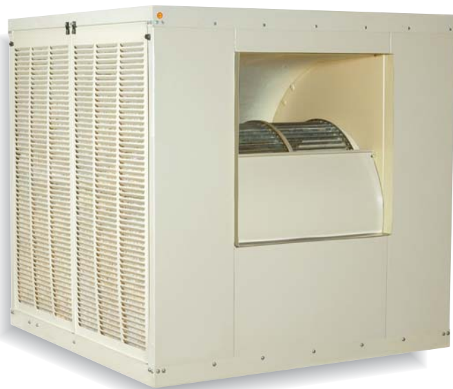
ES143 / ES213